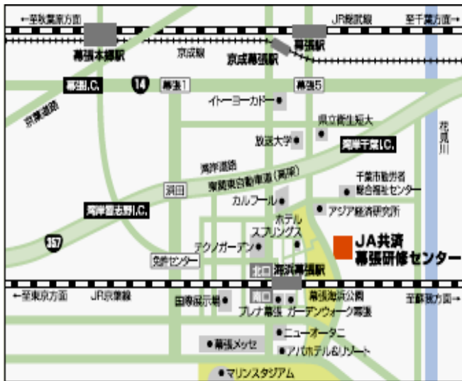
J R 京葉線・総武線、京成線からのアクセス関係図