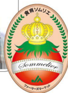
えびさわ きよこ 蛭沢清子